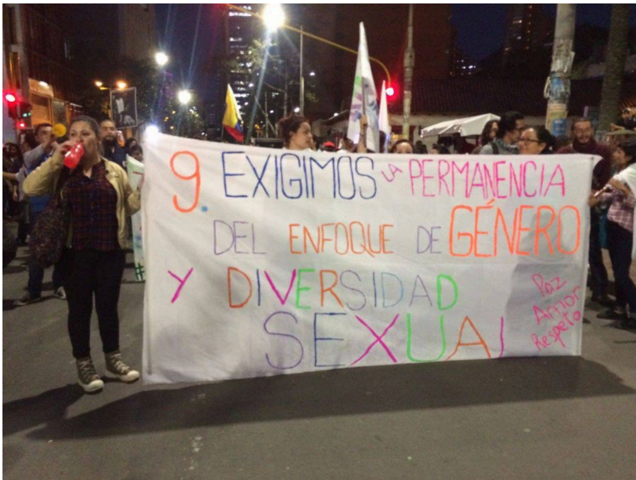
Marcha en defensa da perspectiva de xénero nos acordos de paz en Colombia.

A organización feminista Capire no seu artigo «2022: las mujeres del mundo marcharon por la paz, la democracia y la soberanía» repasa as posicións das mulleres ante os conflitos bélicos nos últimos anos. O inicio da guerra entre Rusia e Ucraína «fixo reverberar o carácter imperialista e patriarcal das guerras no mundo» e a defensa da paz colleu forza nas axendas políticas europeas.