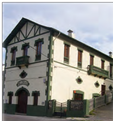
Antigo Teatro Helenias de Boal, hoxe convertido en aloxamento turístico

En Navia e Boal tamén existiu unha produción xornalística importante base da actividade cultural destas vilas.