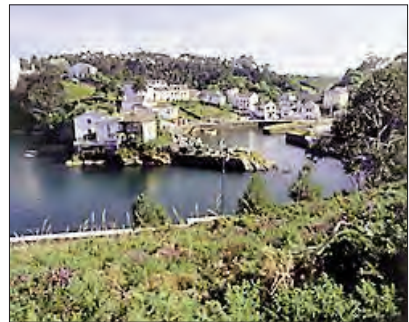
Paisaxe de Valdepareas

Entre as súas pezas destacamos El que estudia algo aprende , Extraño viaxe e Pra el amor nunca é tarde , sainete cuxo fragmento incluimos nesta antoloxía 10 .