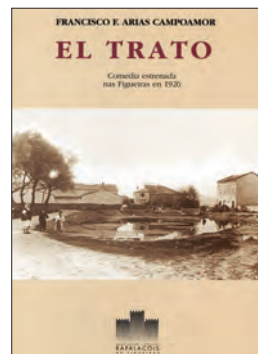
Cuberta da edición realizada por Xosé F. Suárez Fernández

A obra foi rescatada e publicada por Xoán Babarro dentro da súa tese de doutoramento Galego de Asturias. Delimitación, caracterización e situación sociolingüística 16 , e posteriormente Xosé Miguel Suárez Fernández realizou unha edición de autor que foi publicada pola Asociación Rapalacóis das Figueiras 17 . Aquí recolleemos un fragmento da versión da tese de Babarro.