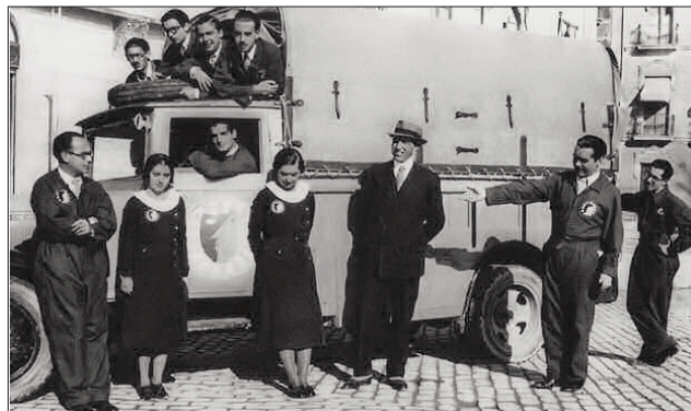
Fotografía de Lorca e a súa compañía La Barraca

Ademais de querer culturizar un maior número de xente, co teatro de monicreques buscábase transmitirles o folclore ós máis novos, para facelos partícipes das tradicións, obxectivo principal do teatro aldeano . Deste xeito, nas numerosas veladas que se organizaron as obras que se representaban eran de marcado carácter folclórico.