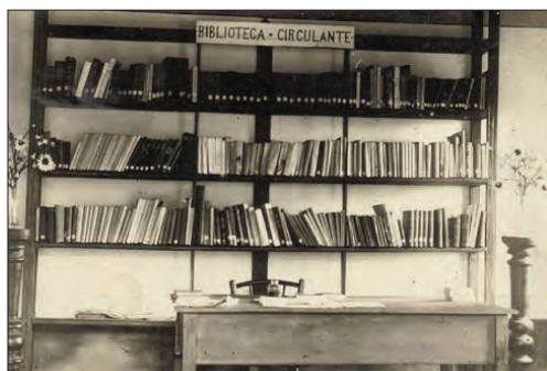
Imaxe da Biblioteca Popular Circulante nos seus inicios

Pero ademais, a Biblioteca realizou diversas actividades de divulgación cultural como conferencias, lecturas comentadas, cursos de historia, concertos, funcións teatrais, sesións de contos, audições de música e proxeccións de cine educativo.