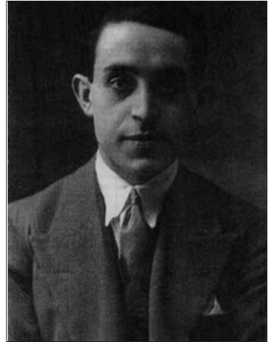
Fotografía Francisco F. Arias Campoamor

A súa afección pola literatura levouno a colaborar nos xornais locais como Las Riberas del Eo e da emigración como El Heraldo de Asturias de Bos Aires. A maioría das súas contribucións eran artigos de costumes, biografías e crítica literaria.