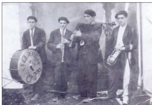
Fotografía do cuarteto Os Quirotelvos