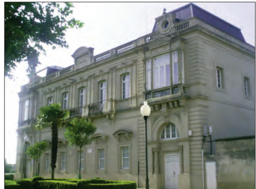
Casino de Castropol