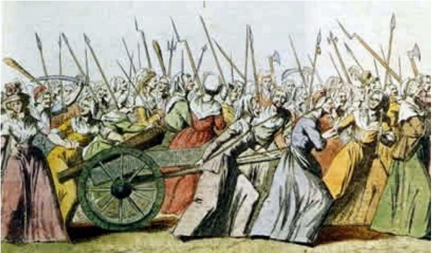
photo_camera Mulleres marchando contra Versalles.

"En Madrid existía a convicción de que todo o Reino da Galiza se atopaba alborotado e sublevado e que os motíns se estendían a todo o país", relata Jesús de Juana López.